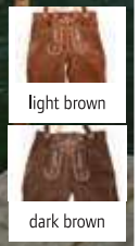
7 Leather Trousers long/women 60.3207

Bestickbarer Wechsel-Brustschild für Lederhosen 100% Rindsleder Hosenträger mit bestickbarem Brustschild passend zu Lederhosen 3001, 3101, 3203 und 3207, verstellbare Träger, Brustschild-Verstärkung kann per Klettverschluss für eine einfache Veredelung abgenommen werden, Metallschließen, Brustschild Maße: ca. 23x9cm, am Bund anknüpfbar onesize € 100 € 1 € 17,95