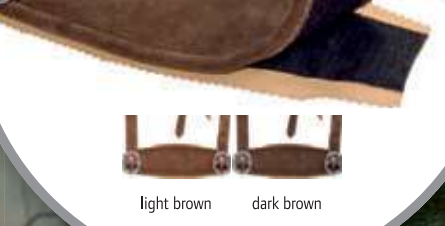
6 Changeable Chest Shield 60.3000

Herren Lederhose lang 100% Rindsleder Traditionelle 3/4 lange Herren Lederhose, inkl. Träger und Brustschild, Stickereien an den Seiten und vorne S - M - L - XL - XXL - 3XL € 20 € 1 € 88,50