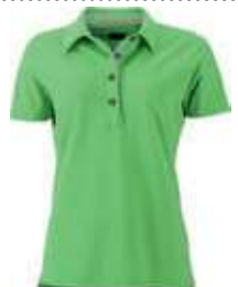
lime green/lime green white